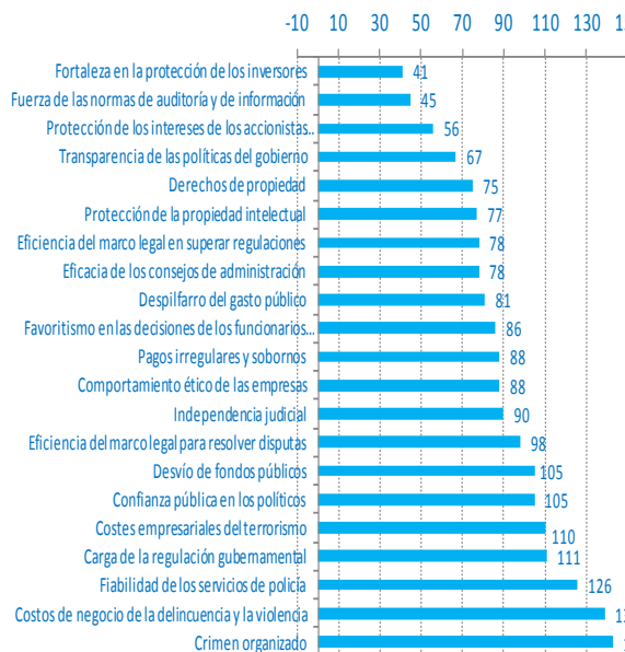
Gráfico 2 Evaluación de la fortaleza institucional de México en el Índice de competitividad global (índice, la peor evaluación está en la parte baja de la gráfica)