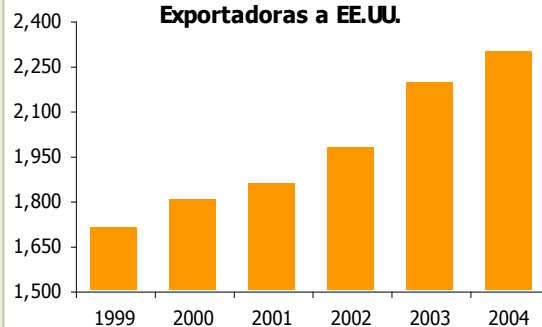
Perú: Número de Empresas Exportadoras a EE.UU.

El 10 de mayo, representantes del Poder Ejecutivo de Estados Unidos anunciaron que el Gobierno y el Congreso habían alcanzado un acuerdo en cuestiones laborales y en la visión de comercio internacional del país, lo que