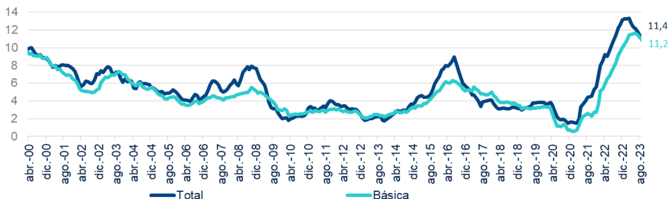
Gráfico 1. INFLACIÓN TOTAL Y PRINCIPALES CANASTAS (*) (VARIACIÓN ANUAL, %)

Desde BBVA Research esperamos que la inflación mantenga su senda decreciente, aunque la volatilidad en la inflación de alimentos puede moderar las reducciones esperadas, particularmente ante expectativas de efectos del fenómeno de El Niño hacia el cierre del año. La inflación básica, por su parte, descenderá de forma moderada en términos anuales en los próximos meses, aunque pueden haber riesgos al alza de presentarse un consumo más resiliente. No obstante, la inflación total seguirá cediendo y podría cerrar el año en torno al 9% manteniendo una dinámica de disminuciones en 2024.