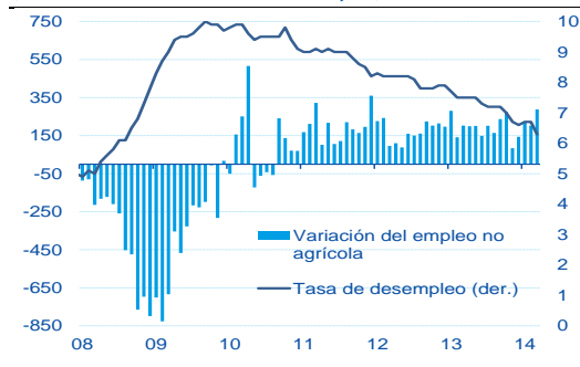
Gráfica 1 Tasa de desempleo y empleo no agrícola (variación mensual en miles, %)

Enfrentados al reto de elegir un conjunto de medidas fiables que sirva adecuadamente para subir las tasas de interés a corto plazo y controlarlas una vez se hayan subido, las opiniones de los participantes en la reunión discreparon sobre las combinaciones de herramientas de política monetaria. Con un balance de 4.25 billones de dólares, la lista de herramientas de política monetaria de las que dispone en la actualidad la Fed, además de las tasas de interés sobre las reservas en exceso, son las operaciones de recompra inversa con tasa de interés fija a un día (ON RRP), acuerdos de recompra inversa y la línea de crédito para depósitos a plazo (TDF). El control sobre las tasas de interés a corto plazo, el balance de la Fed, las remesas al Tesoro, el funcionamiento del mercado de los fondos federales y la estabilidad financiera son la primera línea de opciones que tiene el FOMC para decidir la combinación apropiada de "nuevas" herramientas para el futuro.